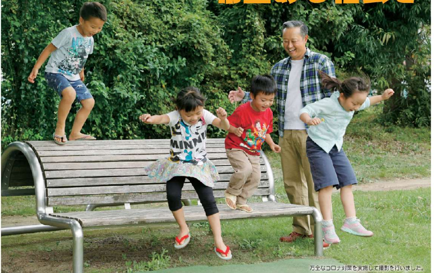
万全なコロナ対策を実施して撮影を行いました。