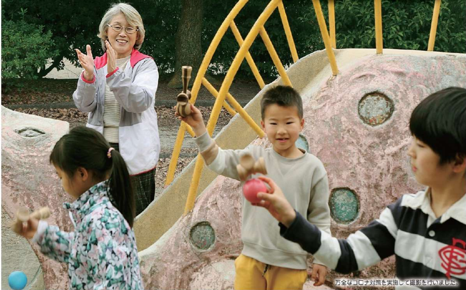
万全なコロナ対策を実施して撮影を行いました。