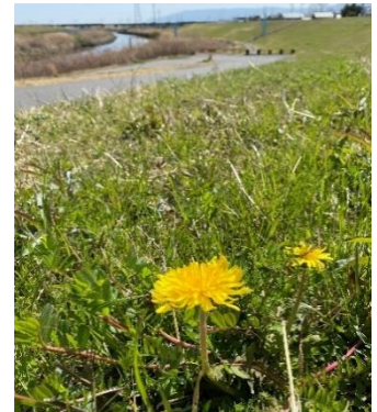
杭瀬川公園近く土手 3/18