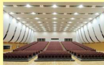
(例 兵庫県 洲本市文化体育館)

客席 1394席 (1階(432席) 2階(570席) 3階(392席)) 電気音響 (オーケストラ用ではない)