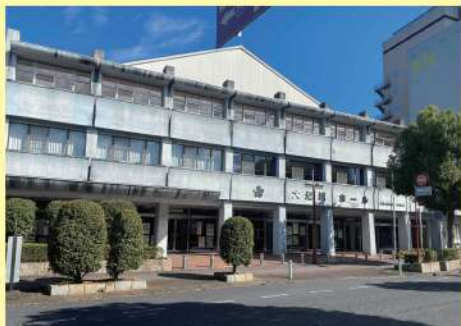
大垣城ホール 大ホール現況

跡地には駐車場ではなく、例えば子どものための児童館など、有効活用の検討が必要です。