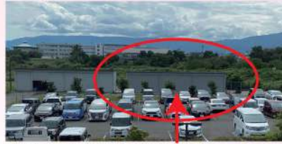
▲2,000万円で建設したごみ袋倉庫 (クリーンセンター敷地内、受付2Fから撮影)