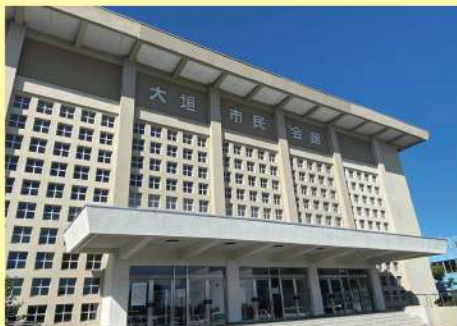
大垣市民会館 大ホール現況

客席 1180席 (2階観覧席ベンチシート) バドミントンコート9面 テニスコート3面