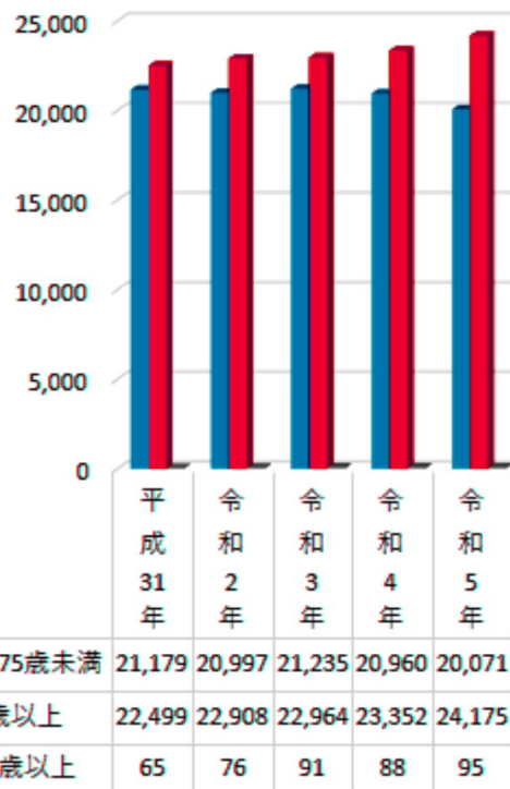
大垣市高齢者人数

大垣市の後期高齢者人口が増え始めています。安心して元気に暮らし続けられるまちづくりに!! 待ったなし!!